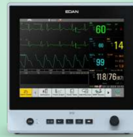
serie X Monitor de Paciente